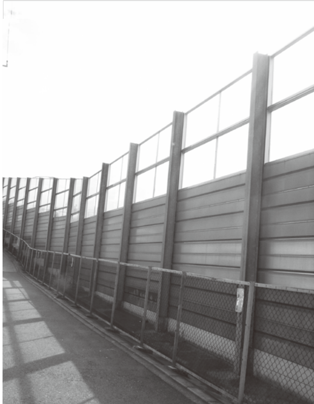
要望が実現し整備された第三京浜の遮音壁